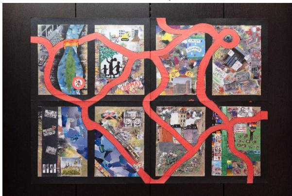
Stadt.Bild – Eine Kartografierung Trierer Stadtteile mit ihren Hoffnungen und Sorgen

Die Kinder, Jugendlichen und jungen Erwachsenen haben sich sowohl künstlerisch als auch inhaltlich auf vielfältige Weise mit dem Thema auseinandergesetzt. Unterschiedliche Perspektiven, Positionen und Kunstgattungen eröffnen den