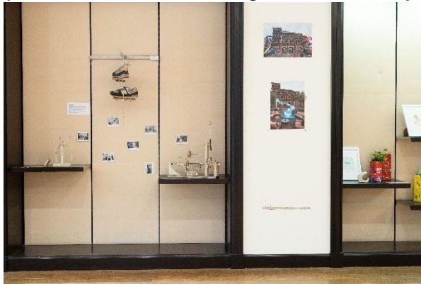
form follows fun! - Spielerische Konstruktionen Gegen städtische von Funktionsflächen aus Beton

All diese Arbeiten zeigen eindrücklich: Die künstlerischen und gedanklichen Beiträge junger Menschen stehen denen von Erwachsenen in nichts nach. Sie eröffnen neue Perspektiven, stellen bestehende Gewissheiten infrage und laden dazu ein, Stadt aus einer anderen Sicht zu betrachten. Es lohnt sich, genau hinzusehen – und vor allem zuzuhören.