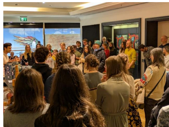
Die Ausstellung in der Trier Galerie findet unter den Besucher:innen großen Anklang.