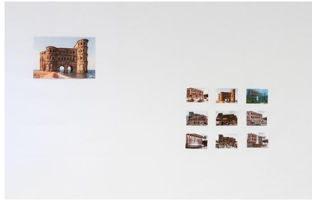
Schüler:innen gestalten Trierer Plätze mithilfe von KI um

wenn Jugendliche sogenannte Un-Orte und Nicht-Orte ihrer Stadt mithilfe von KI in fantasievolle, absurde und zugleich anregende Realitäten verwandeln; und wenn junge Erwachsene im Medium des Podcasts oder in ausgearbeiteten Vorschlägen über Probleme und Chancen ihrer Stadt reflektieren – dann wird deutlich, wie präzise, kritisch und zugleich visionär junge Menschen ihre Umwelt wahrnehmen und gestalten können. Andere Teilnehmende entwarfen utopische Häuser oder setzten sich in experimentellen Verfahren mit grundlegenden Fragen der Stadtentwicklung auseinander, etwa durch das Prinzip der Überlagerung, der Veränderung und der Prozesshaftigkeit von Raum.